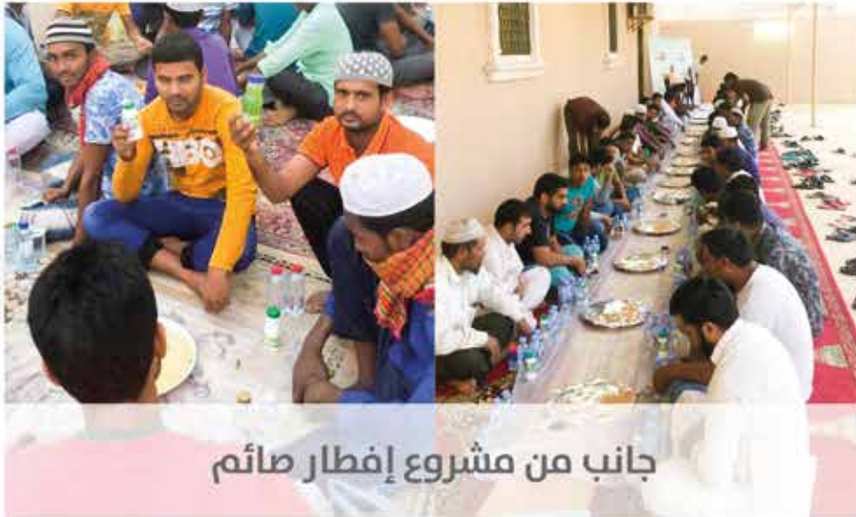
جانب من مشروع إفطار صائم