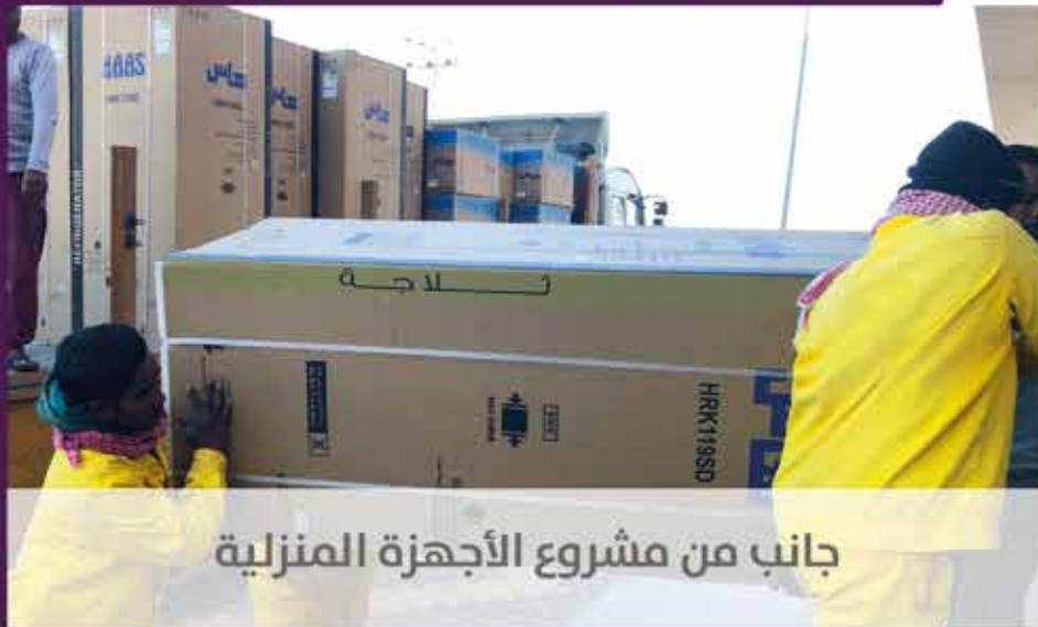
جانب من مشروع الأجهزة المنزلية