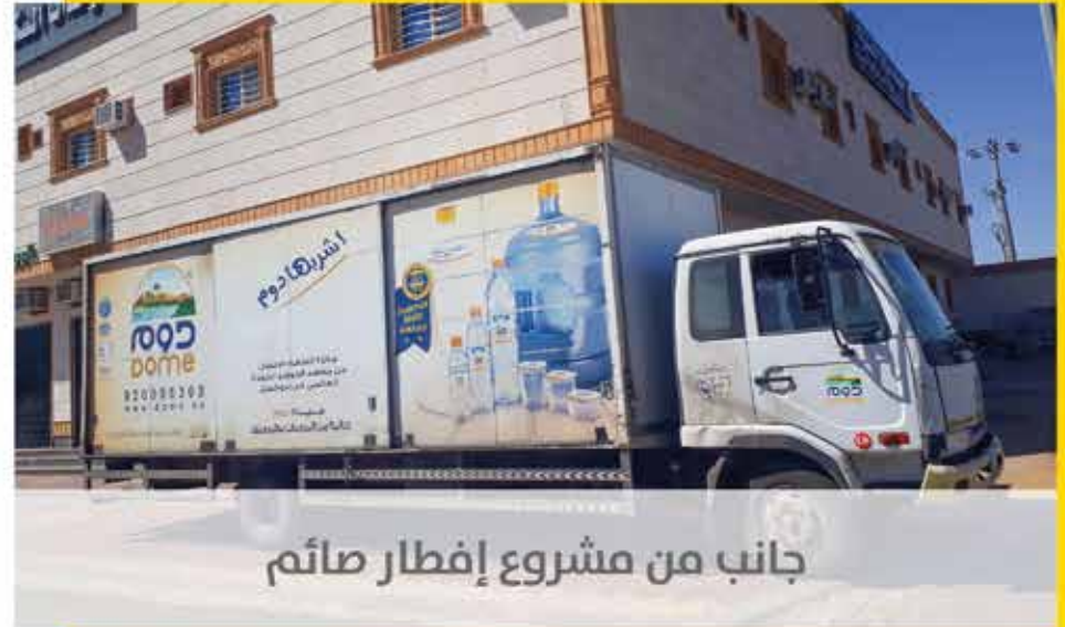
جانب من مشروع إفطار صائم