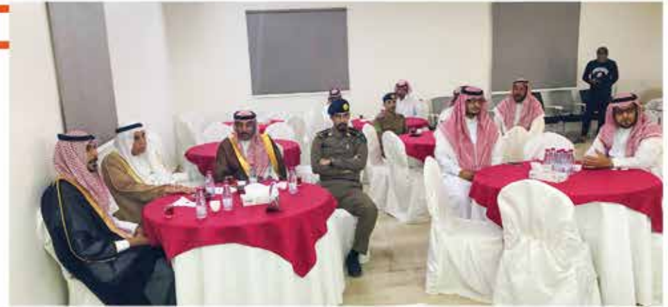
جانب من ندوة إسبوع البيئة