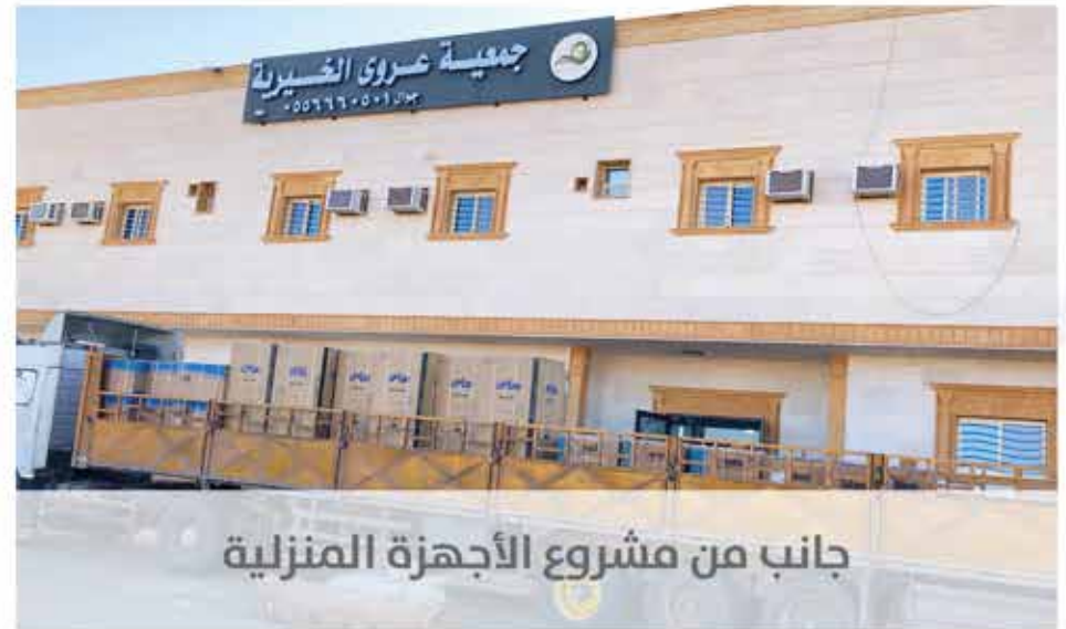
جانب من مشروع الأجهزة المنزلية