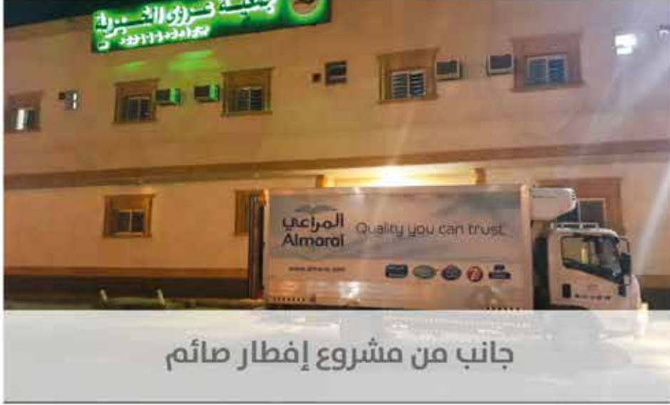
جانب من مشروع إفطار صائم