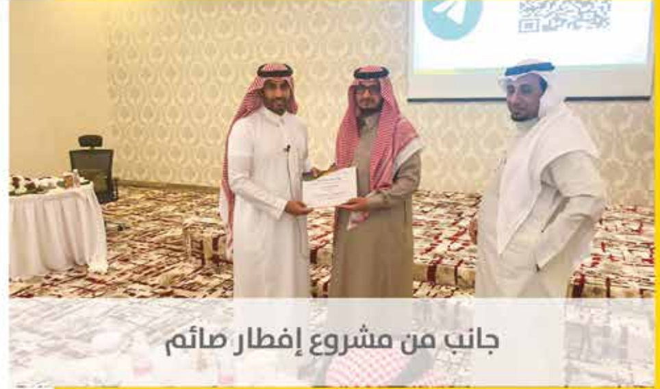
جانب من مشروع إفطار صائم