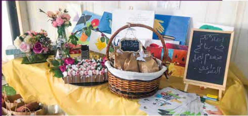
جانب من برنامج مفهوم العمل التطوعي