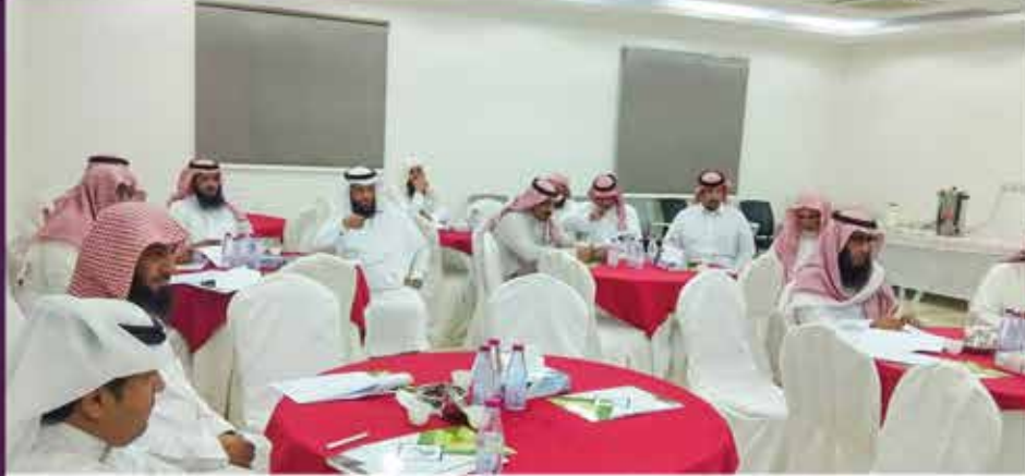
جانب من إجتماع الجمعية العمومية