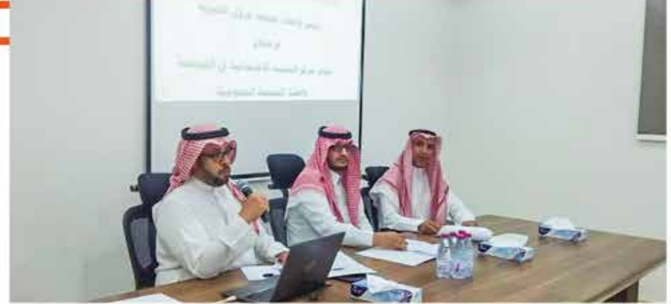
جانب من إجتماع الجمعية العمومية